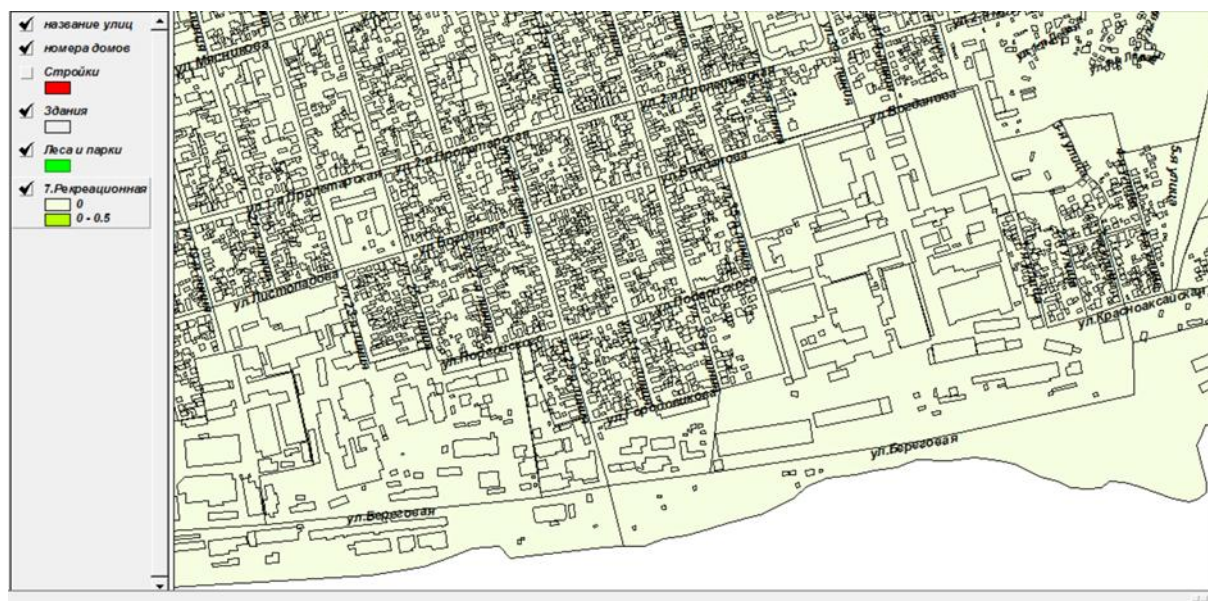
Рис. 5. – Электронная карта рекреационной ценности

В рассматриваемом проекте для улучшения экологической обстановки мы предлагаем использовать эксплуатируемую зеленую кровлю, а для повышения энергоэффективности здания использовать ВИЭ [6], в частности, солнечной энергии, с устройством на кровле солнечных панелей.