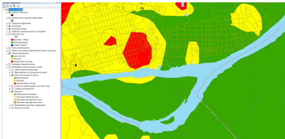
Рис. 4 – Электронная карта экологического риска

Анализируя данные, полученные с электронных карт, мы делаем вывод, что строительство дома с использованием энергоэффективных технологий окажет благоприятное влияние на окружающую среду [5]. А в будущем, строительство целого жилого комплекса из аналогичных домов значительно улучшит экологическую обстановку данной территории.