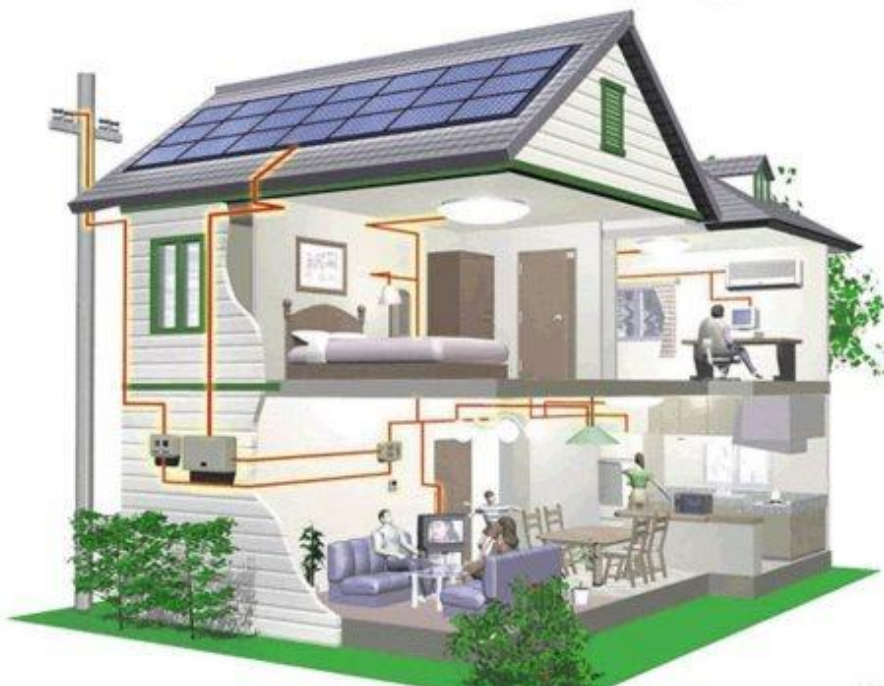
Рис. 3. – Инженерные решения

2. Конструктивные решения. Для более эффективного регулирования воздушных потоков в здании используют трансформируемые конструктивные решения.