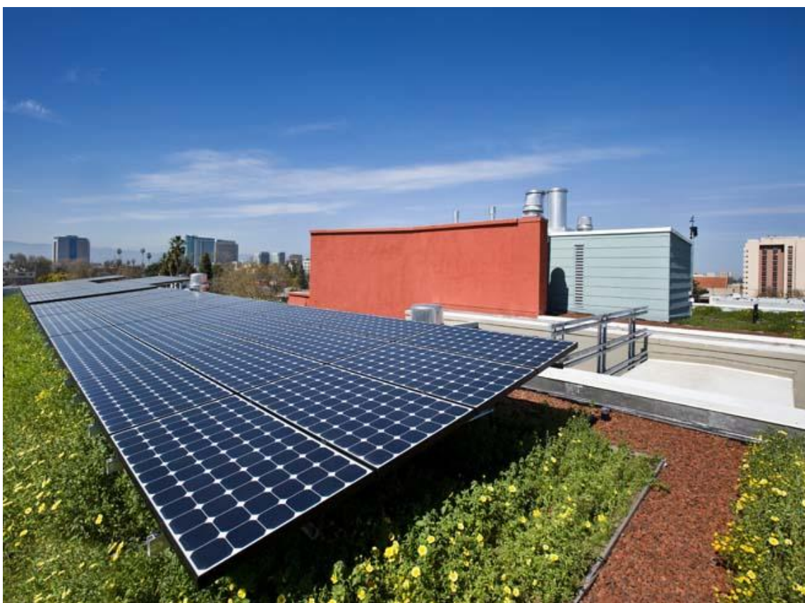
Рис. 6 – Пример совмещения солнечных панелей и эксплуатируемой зелёной кровли

- увеличение долговечности кровли. Наличие солнечных панелей на кровле позволяет защитить её от атмосферных воздействий, снижает количество наледи, так как в рабочем режиме панели выделяют тепло.