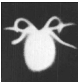
Рис. 3. - Хламидомонада Рейнхардта [6]. Кратность 3

Однако при всех плюсах метода скоростного компьютерного видео у него остаются и недостатки: