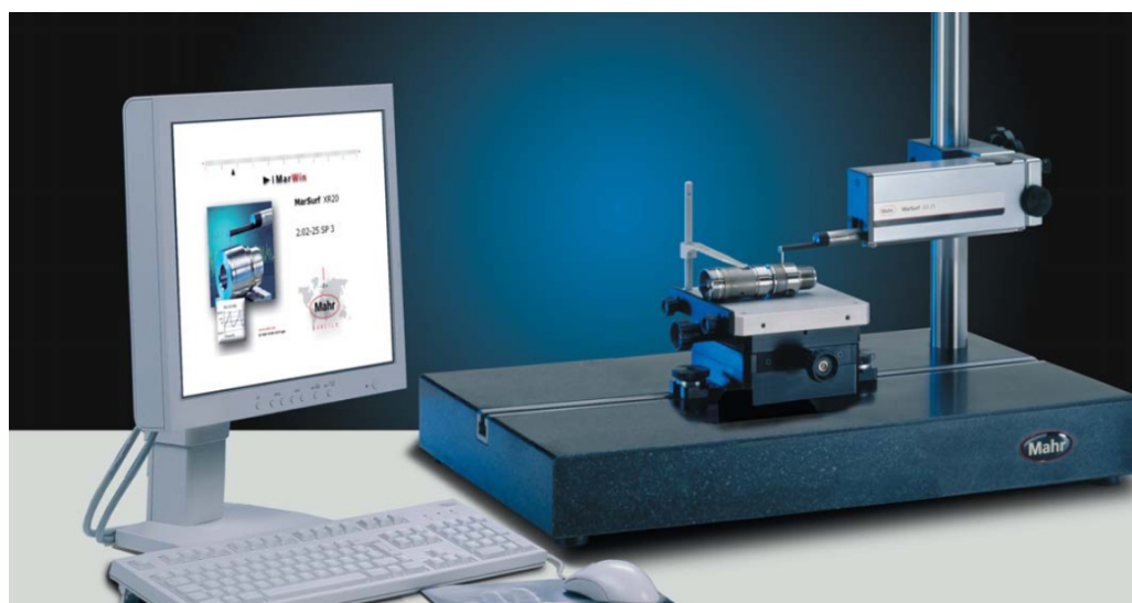
Рис. 1. – Система MarSurf XR20

Действие прибора основано на принципе ощупывания неровностей исследуемой поверхности алмазной иглой (щупом) и преобразования возникающих при этом механических колебаний щупа в изменения напряжения, пропорциональные этим колебаниям, которые усиливаются и преобразуются в микропроцессоре. Результаты измерений выводятся на монитор компьютера для выполнения дальнейших расчетов.