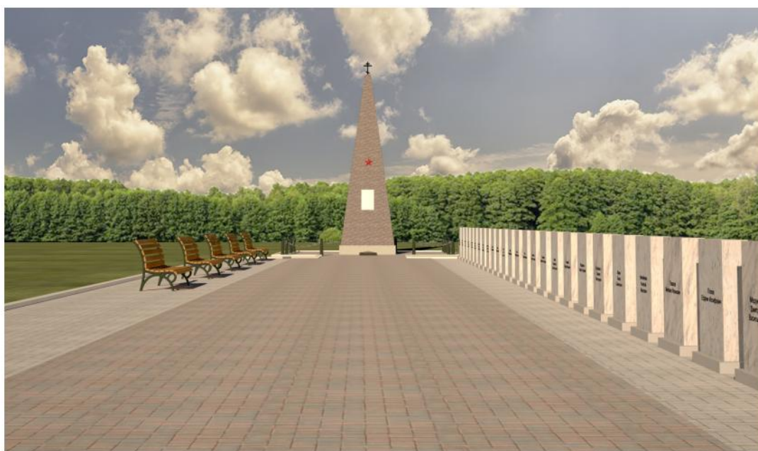
Рис.2. Дизайн-проект (разработанный в рамках ремонта)