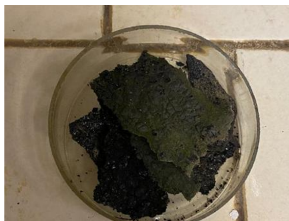
Рис. 1 – Исследуемый кровельный материал после 15 лет эксплуатации

Рекуперация (извлечение) — возвращение части материалов для повторного использования в том же или подобном технологическом процессе. Битумные вяжущие вещества, находящиеся в кровельных материалах, постоянно подвержены воздействию УФ-излучения и многократным температурным перепадам, что, в свою очередь, активно стимулирует процессы старения [7]. В результате этого, происходит перераспределение групповых структур битума, сопровождающееся потерей низкомолекулярной фракции, поэтому битумные вяжущие теряют свою