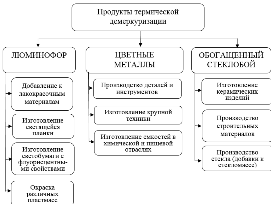
Рис. 2. – Возможные пути использования продуктов термической демеркуризации

концентрат, а также использовать очищенный от ртути люминофор, цветные металлы и стеклобой повторно при производстве различных изделий и материалов.