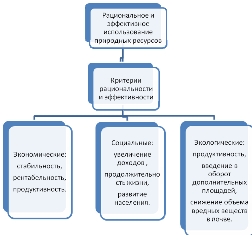
Рис. 2. Классификация критериев рационального и эффективного использования природных ресурсов

Экономические критерии применяется для оценки результатов производственной деятельности на определенный период в динамике, для сопоставления уровня эффективности по предприятиям, отраслям, межотраслевым комплексам, а также по районам, областям и страны в целом. Основным показателем экономической эффективности является рентабельность.