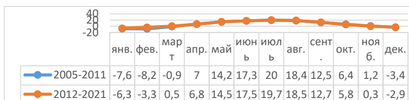
Рис.2. - Средние температурные значения в год по городу Москва

Существует много вариантов сокращения пагубного влияние жилищной сферы на окружающую среду [8]. Большинство задач решаются адаптацией систем здания к климатическим изменением [9]. На графике наблюдается потепление в отопительный период в течение последних 10 лет (рис. 2). Эти данные стоит учитывать при проведении работ по КР с