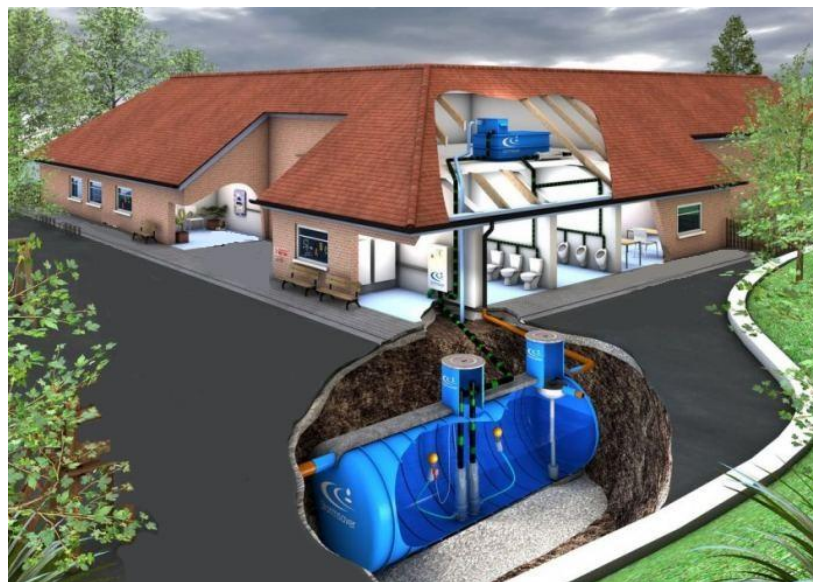
Рис. 1. – Система сбора дождевой воды

Наиболее эффективным считается сбор воды с крыши; как правило, уклона в десять градусов и более достаточно для прохождения дождевой воды в накопитель самотеком, для плоской же кровли потребуются устройство дополнительных коммуникаций. Система сбора дождевой воды [5] представлена на рисунке 1.