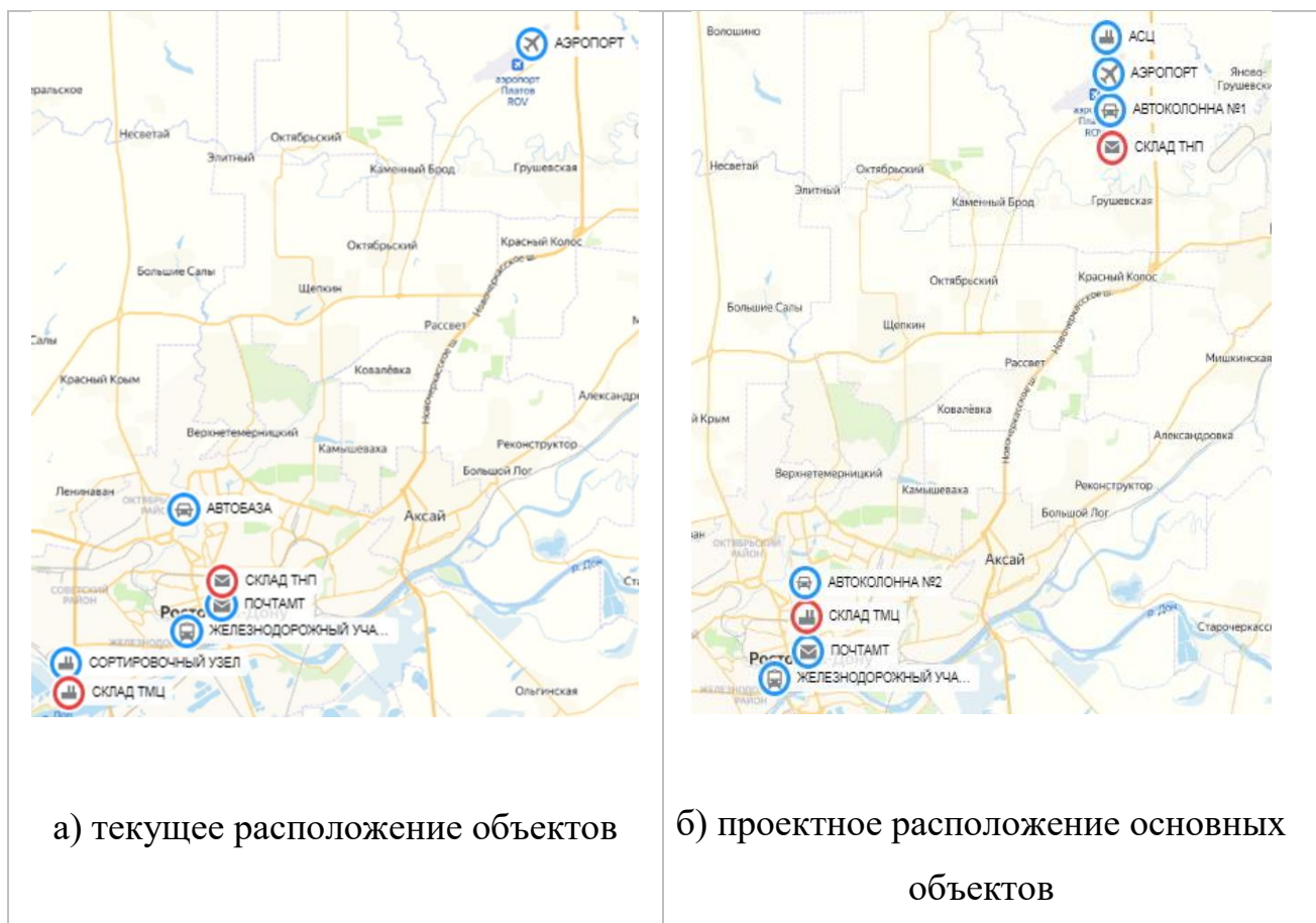
Рис. 4. – Текущее и проектное расположение основных объектов сортировочного центра в г. Ростове-на-Дону

Расположение планируемого автоматизированного сортировочного центра запланировано в непосредственной близости от аэропорта «Платов». Проектное расположение основных объектов представлено на рис. 4б.