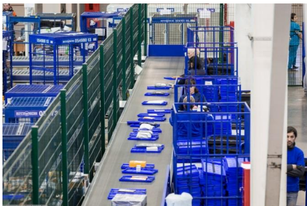
а) автоматическая сортировка