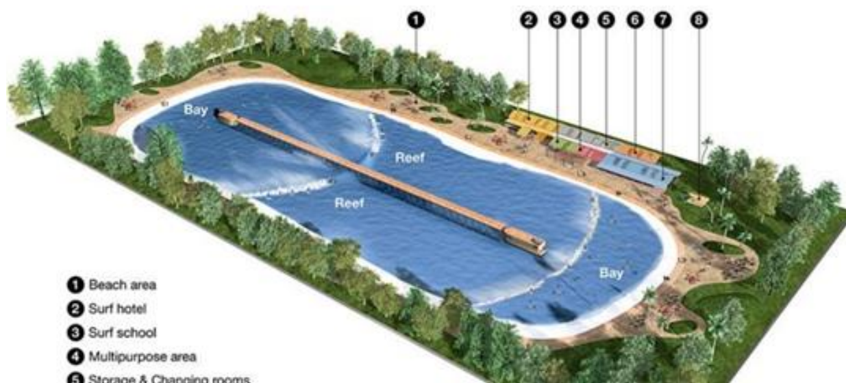
Рис. 3. Сёрфинг-парке NLand в Остине, штат Техас [4].

Расширение зоны залива или включение дополнительных зон со спокойными волнами для пловцов и детей может увеличить пропускную способность, которая в некоторых случаях может даже удвоиться.