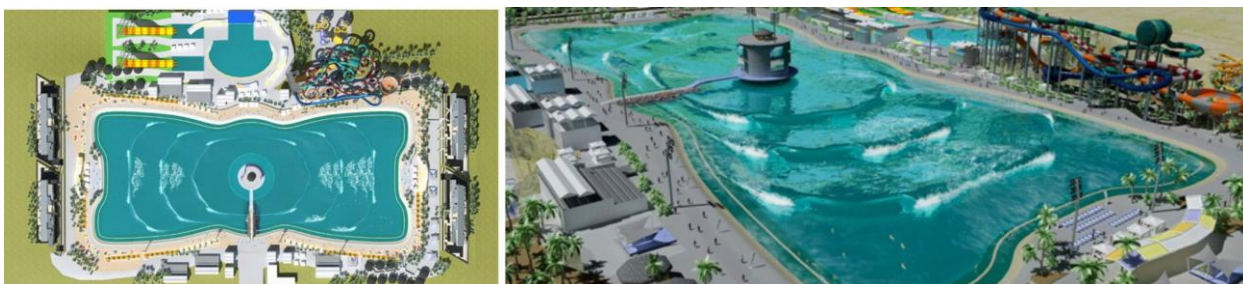
Рис. 5. Surf Lakes – Сёрф-озеро, концепт «5 волн» [7].

(Аарон Тревис). В теории, это простая механика – металлический поршень в момент удара по воде образует кольцо водной массы, движущееся от центра до «берега», образуя волны: «The Beach Break» (мягкая волна для начинающих), «Оссу's» (высота волны до 2 метров), «The Point» (быстрая и сложная волна), и «The Wedge» (продвинутая трубящаяся волна). (рис. 5) [7].