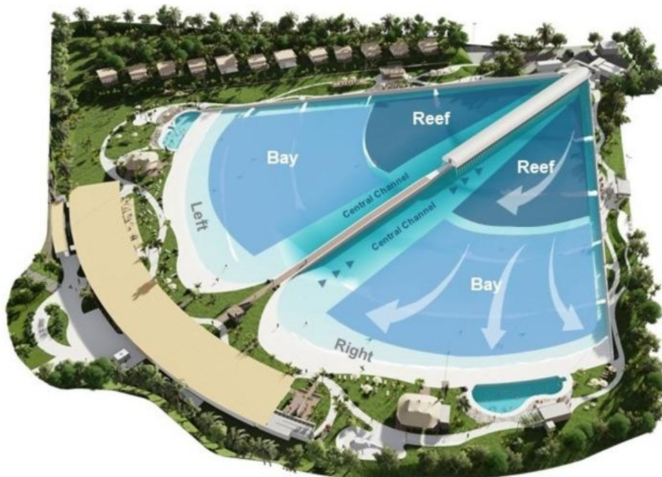
Рис. 2. Стандартный модуль искусственного сёрф-бассейна системы Wavegarden с зонами для начинающих (Bay) и профессионалов (Reef) [3].

Бухты - для начинающих. В каждом отсеке есть три различные зоны, подходящие для начинающих и промежуточных уровней спортсменов. Волны мягкие и медленно движущиеся, что позволяет спортсменам получить опыт в реальных океанских условиях. Полностью контролируемые условия делают его самым безопасным местом в мире для обучения сёрфингу. Система волн обеспечивает значительную эффективность обучения: одночасовой сеанс эквивалентен одному месяцу или более сеансов серфинга в океане. Вместимость зоны бухты - до 48 сёрферов. Глубина воды – 0,1-0,8 м, высота волны – 0,5-1 м, длины волны – 12-15 секунд [3].