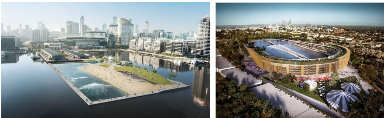
Рис 4. Сёрф-бассейна для г. Мельбурн [5]. Subi Surf Park by MJA Studio and Wave Park Group (Австралия) [6].

Проект реновации спортивного стадиона в искусственный парк для сёрфинга предполагает: бассейн 300 x 120 м, наполненный пресной водой; шесть зон с разными размерами волн, для сёрферов и профессионалов; искусственный пляж в окружении 5-этажного многоквартирного дома с 220 квартирами (1- и 2-комнатными); общественный парк, специализированный крытый рынок, гостиницу и оздоровительные центры (Рис. 4) [6].